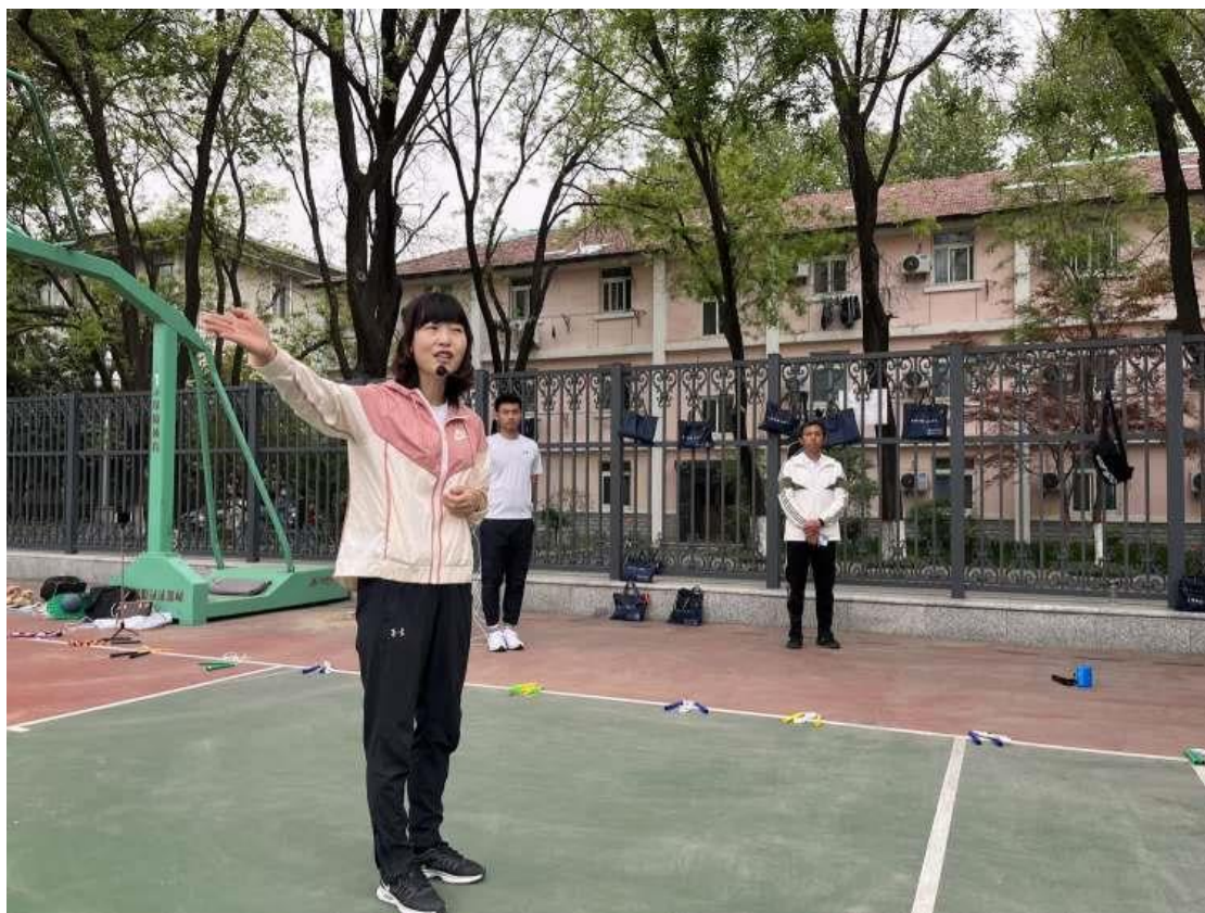
专业教师展示花式跳绳，活跃课前气氛。课前热身，学员们兴致盎然。