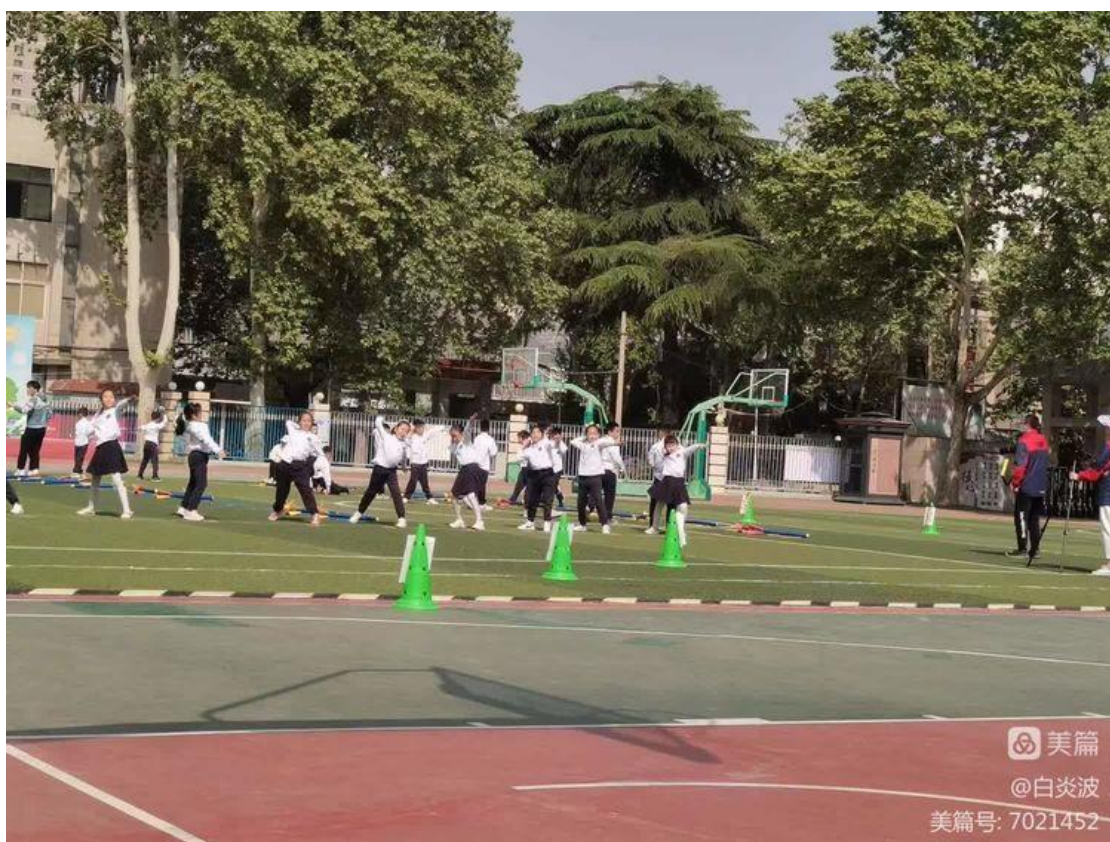
第二节课是宁州带来的《轻物掷远—勇敢的小战士》